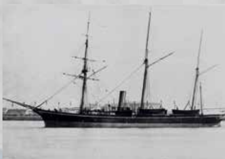
H.M. Bonaire (later omgedoopt Abel Tasman) hield toezicht op de quarantaine-maatregelen op de rede van IJmuiden tijdens de cholera-epidemie van 1892.

De Standaard vermeldde dat de regering overwoog om ook voor IJmuiden een quarantaineplaats voor de scheepvaart aan te wijzen. Bedenk hierbij wel dat het Noordzeekanaal datzelfde jaar geopend was. Bij het graven van dat grote kanaal in 1866 had overigens onder werklieden de cholera-epidemie genadeloos toegeslagen.