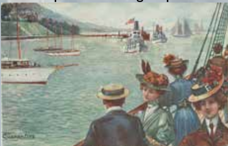
Quarantine, a trip to Europe'. Het achterste schip voert de gele quarantainevlag.

En dat op straffe van het verbranden van schip en belading. Opvarenden