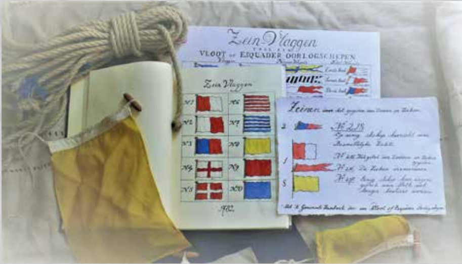
De gele vlag werd gehesen als teken van quarantaine.