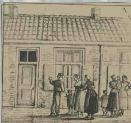
Ramptoeristen bewonderen het huis van Goeie Mie in Leiden. Detail afkomstig uit Geïllustreerd Politienieuws 1883